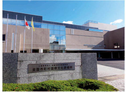
滋賀県大津市：国際文化アカデミー